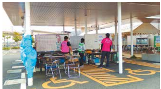
倉敷市災害ボランティアセンター： その かわ べ 園・川辺サテライト

広島県三原市(2名)、広島県広島市(1名)、 広島県東広島市(3名)、岡山県倉敷市(2名)