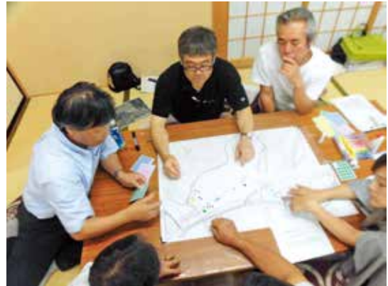
吉定集落 (吉定地区マップ作りの様子)